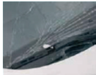
14. Törött ablak