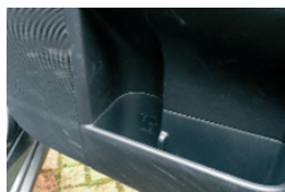
8. Belső berendezések, úgy, mint az ajtóban lévő szemetes doboz, nem hiányozhat, kiürítve kell lenni, károsodás nem érheti