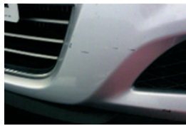
2. Karcolás a lökhárítón