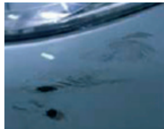
13. Karcolások és károk a fényezésen