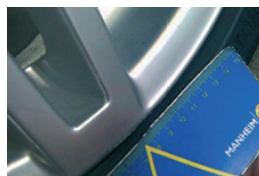
9. Díztárcsa kopás