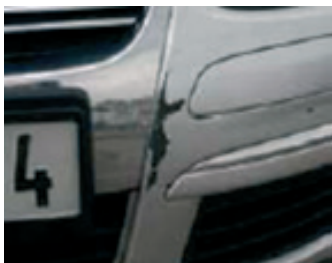
15. Karcolás a motorháztetőn, horpadás és kopás (karcolás 100 mm mélyig, horpadás 20 mm mélyig elfogadható)