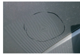
5. Horpadás a vázszerkezeten