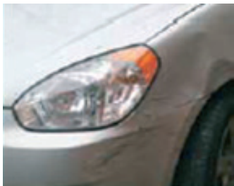
11. Horpadások és motorháztető csorbulás