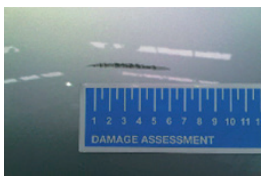
6. Kopás az autó külső felületén