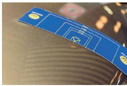
1. Csorbulás a motorháztetőn