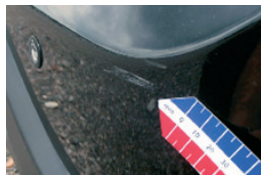
3. Karcolás a lökhárítón