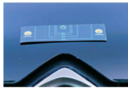
4. Kisméretű horpadás