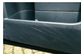
10. Mindennapi használat következtében megjelenő horzsolások elfogadhatók