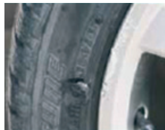
17. Törés, horpadás és lyukak nem elfogadhatók a gumin és a díztárcsán