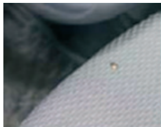
16. Szőnyeg: nem elfogadható lyuk és maradandó kosz folt