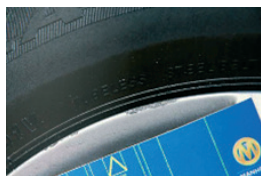
7. Díztárcsa kopás