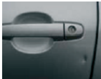
12. Horpadások és csorbulások